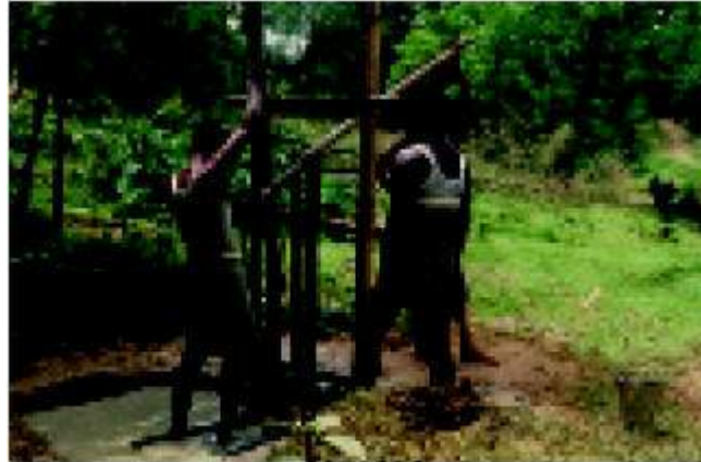
قد يؤدي حفر بئر ماء في بنغلاديش إلى مكمّن مائي ملوث بالزرنيخ.